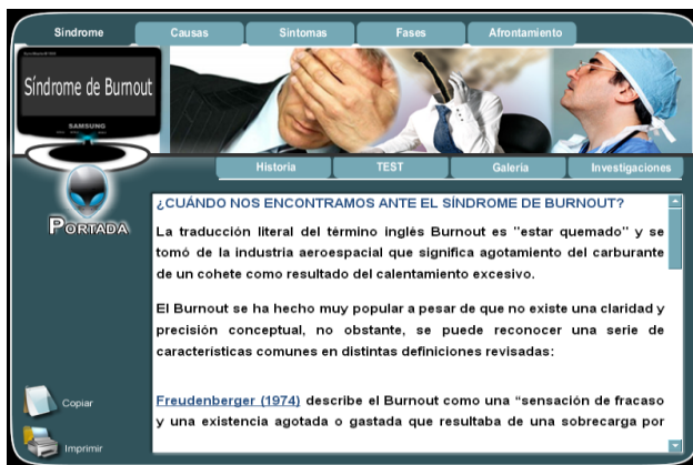
Figura 1. Portada Burnout.