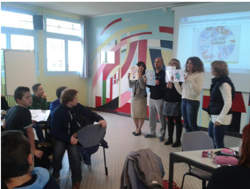
Primera movilidad de profesores y alumnos del IESO Pinar de Salomón.

Además, para cada movilidad, la comisión solicitaría autorización por desplazamiento con 15 días de antelación. Para las movilidades con alumnado sería necesario enviar el listado de alumnos participantes junto al seguro de viaje, autorización de los padres, tarjeta sanitaria europea y DNI o pasaporte en vigor.