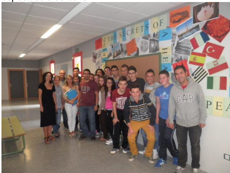
Alumnos y profesores en el rincón Comenius

También serían los responsables del diseño de las sudaderas con el logo e imagen del centro, del diseño de camisetas, de la decoración del centro con las actividades y los documentos que se fueran elaborando a lo largo del proyecto, de los regalos a los socios europeos, de la maquetación del libro de recetas y del folleto de difusión del proyecto. Colaborarían igualmente en la preparación de un espectáculo de baile.