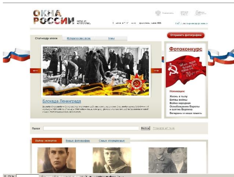
Figura 3. Home page de oknatass.ru

La página Okná Rossii enlaza con una de las últimas y más novedosas acciones relacionadas con la conmemoración de la Victoria, Ura Pobede! [¡Viva la Victoria!]. Esta acción es una continuación de la Cinta de San Jorge y ofrece la descarga en el móvil de las canciones más queridas por los rusos relacionadas con la Victoria, así como la posibilidad de enviar comentarios, fotografías y vídeos en los que el abonado haga el papel de corresponsal de guerra. Según los datos de la propia página, la acción ha obtenido la respuesta de más de 20 millones de abonados a la telefonía móvil en Rusia que han llamado al número gratuito 1945. .