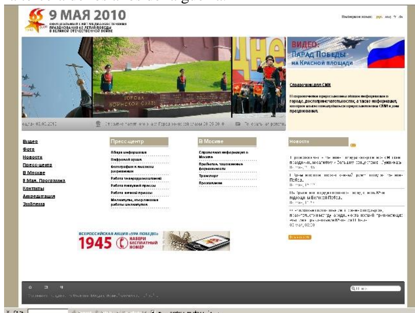
Figura 2. Home page de may9.ru

La sección de fotografía se divide en tres subsecciones más: una galería de fotos de todos los actos de celebración del 65 aniversario —que incluye instantáneas de los ensayos de los desfiles militares terrestres y aéreos en Moscú—, una galería de celebraciones de otros años —con información muy escasa que se reduce a instantáneas del año 2008—, y una tercera de los años de la guerra.