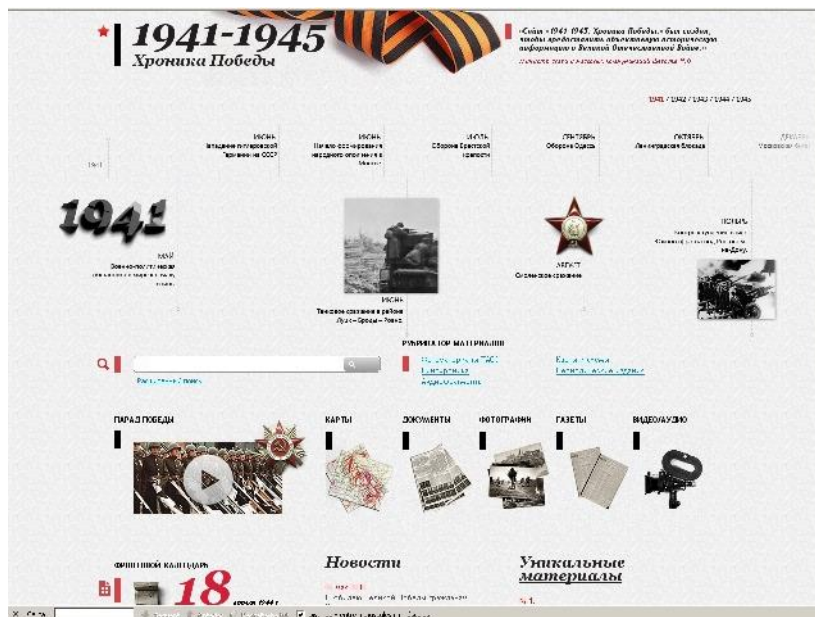
Figura 1. Home page de Crónica de la Victoria