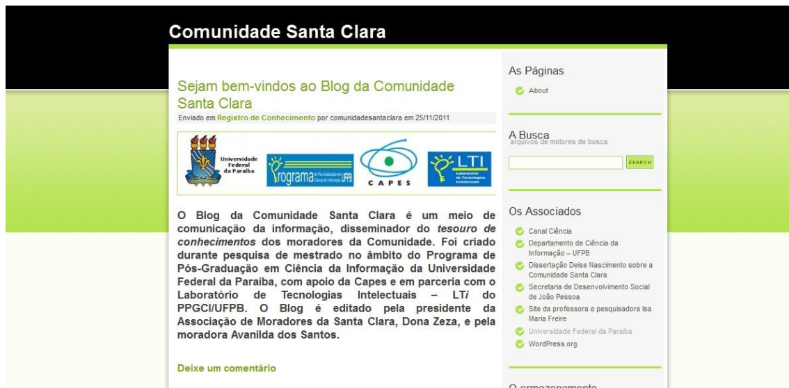
Imagen 1: Blog Comunidade Santa Clara